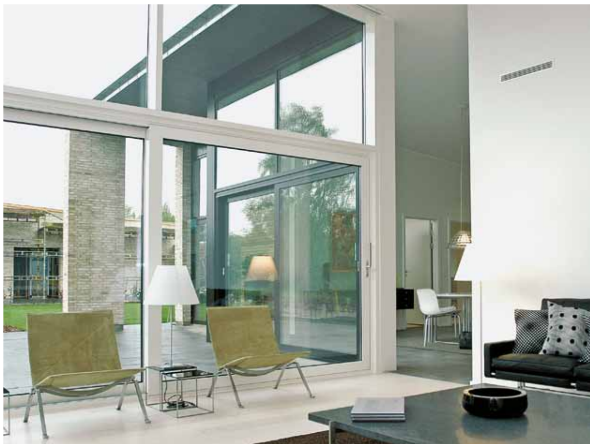
Øget komfort med hæve-skydedøre

En hæve-skydedør gør betjeningen ekstra nem. I lukket position har den en god tæthed og giver således både en udmærket indbrudssikring og god lyd- og varmeisolering. Åbningsvarianterne er enten fra siden eller fra midten. Der kan monteres op til tre løbeskiner, så det bliver muligt at åbne hele 2/3 af elementet.