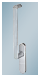
Greb til hæve-skydedør

1) afhængig af rammehøjden 2) afhængig af rammebredde