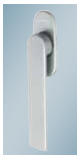
Greb til foldedør