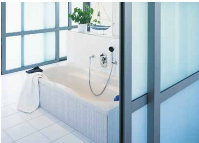
Skydedøre til indvendig brug. Effektiv og fleksibel opdeling af rum

For størrelser og vægt se systemoversigten på side 14.