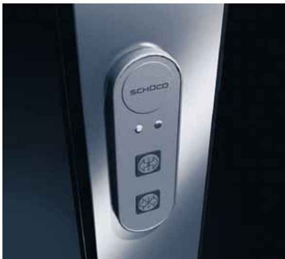
Enkel betjening Tryk på en knap