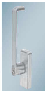
Greb til kip-skydedør