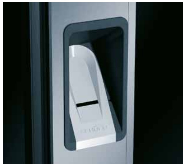
Fingeraftryklæser For sikker adgangskontrol ved indvendige døre