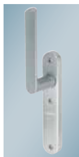
Greb til skydedør