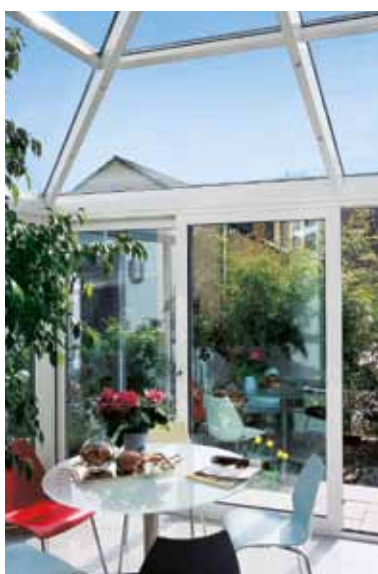
Udestue med hæve-skydedør