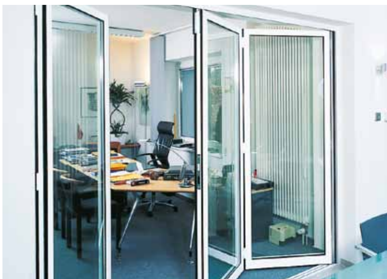
Uisoleret foldedør Til indvendig brug