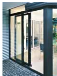
I åben stilling