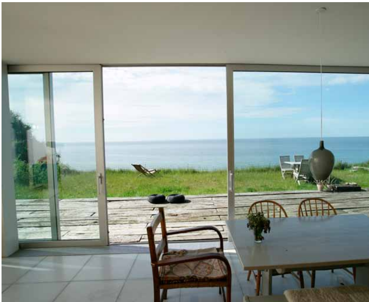
Mere lys giver øget velvære

Med Schücos folde- og skydedøre kan du åbne op og udvide boligarealet og arbejdsområdet. Der findes mange løsninger - lige fra udestuen ud mod haven og folde-skydedøre fra stuen/spisestuen ud mod altanen eller terrassen til fleksible løsninger i kontorlandskaber, caféer og restauranter, der giver mulighed for at åbne op ud mod gaden. Vores døre kan både benyttes i