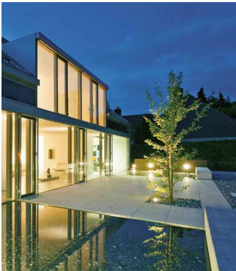
Transparent overgang mellem bolig og natur/inde og ude