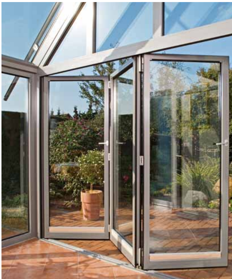
Isoleret foldedør Til brug i ydervægge

For størrelser og vægt se systemoversigten på side 14.