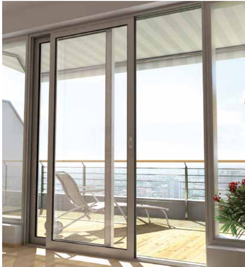
Stilren design Kombineret med intelligent teknik

Der kan opnås en sikker adgangskontrol ved at integrere en fingeraftryklæser i dørkarmen. Døren åbnes ved at føre fingeren hen over den termiske aflæserstribe. Den kan selvfølgelig kun betjenes af den eller de personer, der på forhånd har fået lagret deres fingeraftryk i læsersystemet.