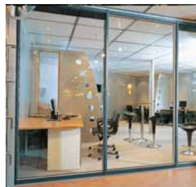
Som rumdeler i et kontorlandskab

For størrelser og vægt se systemoversigten på side 14.