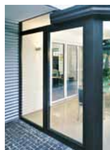
I lukket stilling