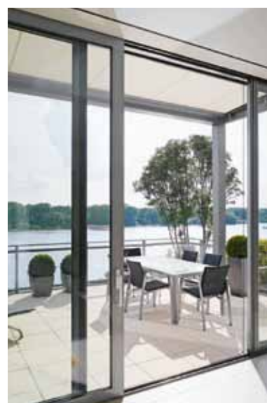
Lejlighed med god udsigt